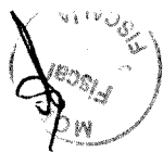
ALBERTO UNDURRAGA VICUÑA Ministro de Obras Públicas